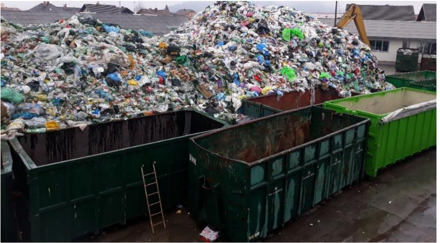
Odpadki pri komunalni Kranj